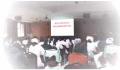
随着艾滋病监测检测覆盖面的

逐渐扩大,艾滋病病毒感染者逐步浮出水面,如何预防艾滋病职业暴露是医务工作者要面临的问题。为进一步加强福建省永安市艾滋病病毒职业暴露的保护工作,规范暴露后的处置,有效控制艾滋病病毒通过职业暴露传播,切实保障医务人员的职业安