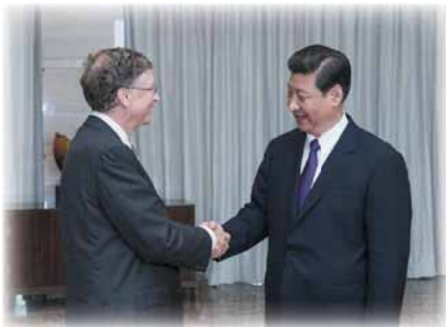
4月8日,中国国家主席习近平在海南省博鳌会见美国盖茨基金会主

席比尔·盖茨。在会见盖茨时,习近平对盖茨基金会同中方有关部门就艾滋病和结核病防治、控烟、生物医药研制等开展的良好合作表示赞赏。表示中国秉持创新驱动理念,鼓励创新、支持创新。中方愿深化同盖茨基金会的合作,希望