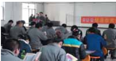
河北诚信化工有限公司是元氏县最大的企业,现有外来务工人员上千人,为强化员工艾滋病防治意识,

主动开展艾滋病防治宣传,4月16日举办艾滋病健康教育知识讲座,特别邀请元氏县专业人员对艾滋病流行形势、传播途径、预防措施、国家“四免一关怀”政策等知识进行讲解。专业人员还对员工提出的问题进行了耐心细致地解答。培训班现场发放宣传折页600多份、安全套300个、宣