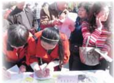
4月25-26日,河北省石家庄市总工会、桥东区总工会、长安区总工会

联合在华夏家园和沿东小区举办了中国妇女健康促进行动暨石家庄市职工红丝带健康教育活动的,石家庄市各区总工会、彭后街道总工会、长丰街道办事处的工作人员和群众代表共200余人参加了活动。喧嚣的锣鼓拉开了此次活动的序幕,同时吸引了大量过往的群众,市疾控专业人员以真实的案例作为开场,以防艾政策作为