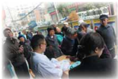
4月15日上午，湖北省利川市疾控

中心防艾工作人员到市逸园广场对广大市民开展预防性病艾滋病知识宣传和义诊活动。活动当天，广大市民前来参加义诊和咨询，市疾控中心防艾工作人员向市民进行了预防性病艾滋病知识宣传，宣传结束后，市疾控中心为市民开展义诊和预防性病艾滋病咨询检测活动，现场为市民解答